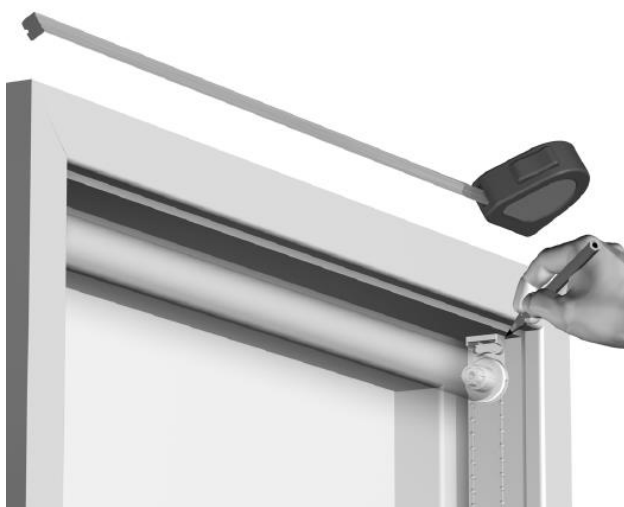
In het kozijn